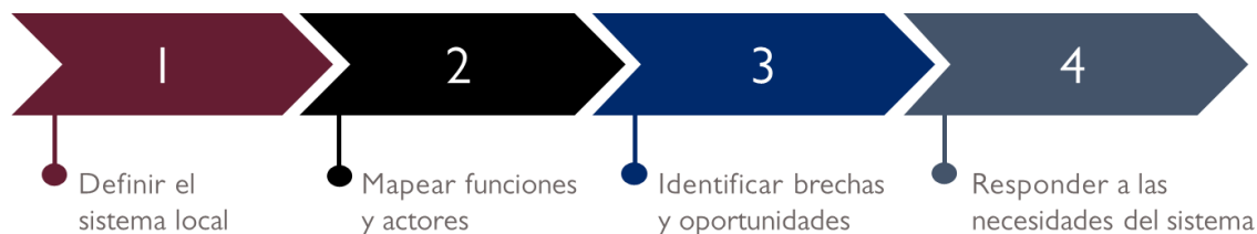
Figura 1: Adaptación de la Metodología de Sistemas Locales a NFM

A continuación se detalla cómo se adopta la Metodología de Sistemas Locales por pasos. En cada uno, se identifican en recuadros los principios de la Metodología utilizados para adaptar este enfoque al contexto de NFM, seguidos por una explicación de cómo se aplican al programa.